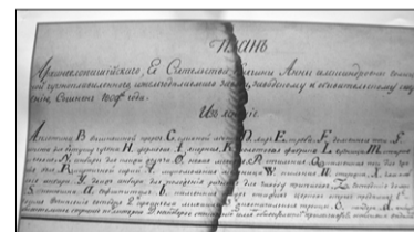
... и фамилии хозяев.