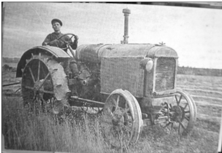
Тот самый трактор.