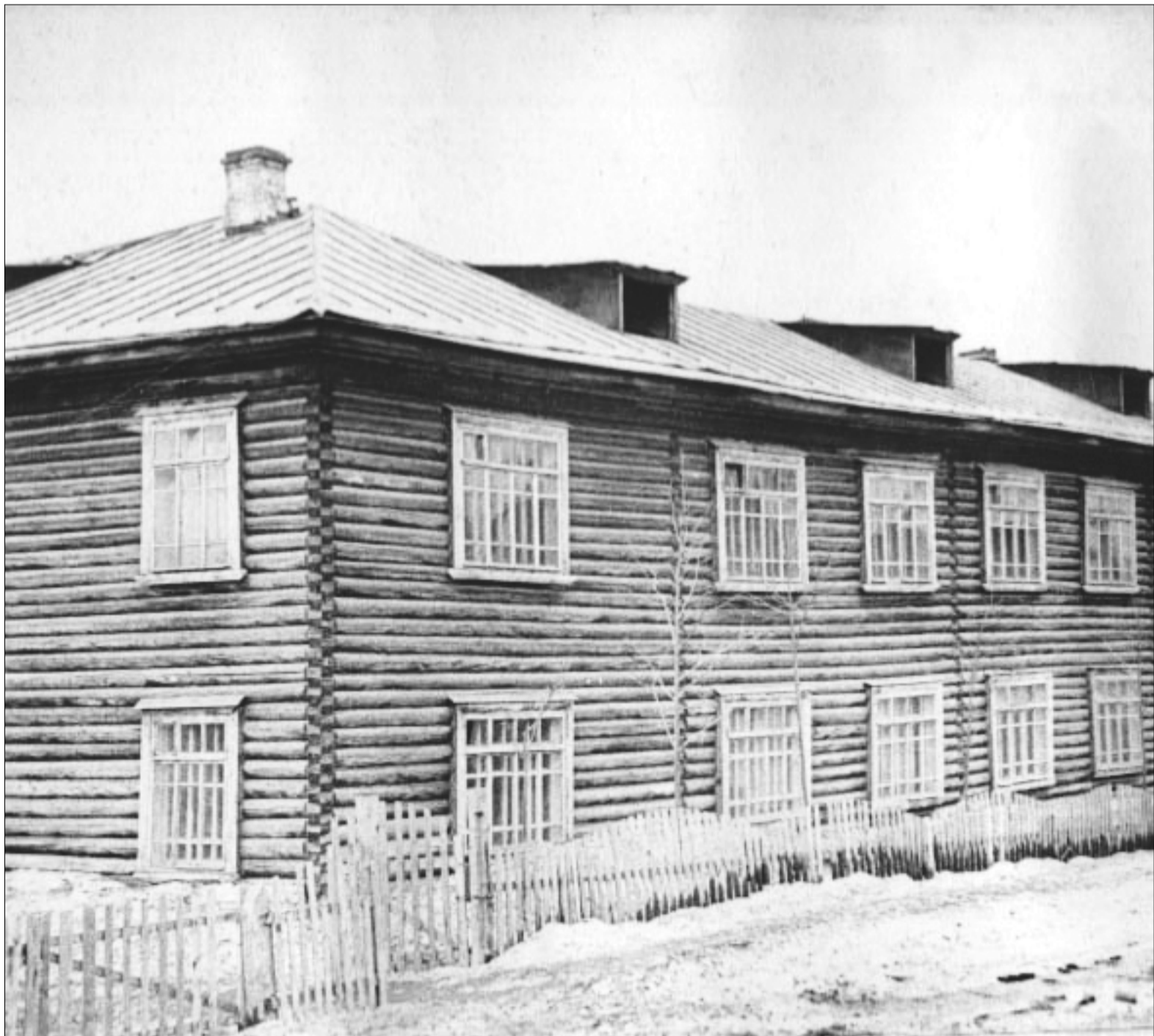
Под госпиталь было освобождено и здание начальной школы по улице Свердловской.

Для удобства доставки раненых заводским комсомольцам было поручено протянуть железнодорожные