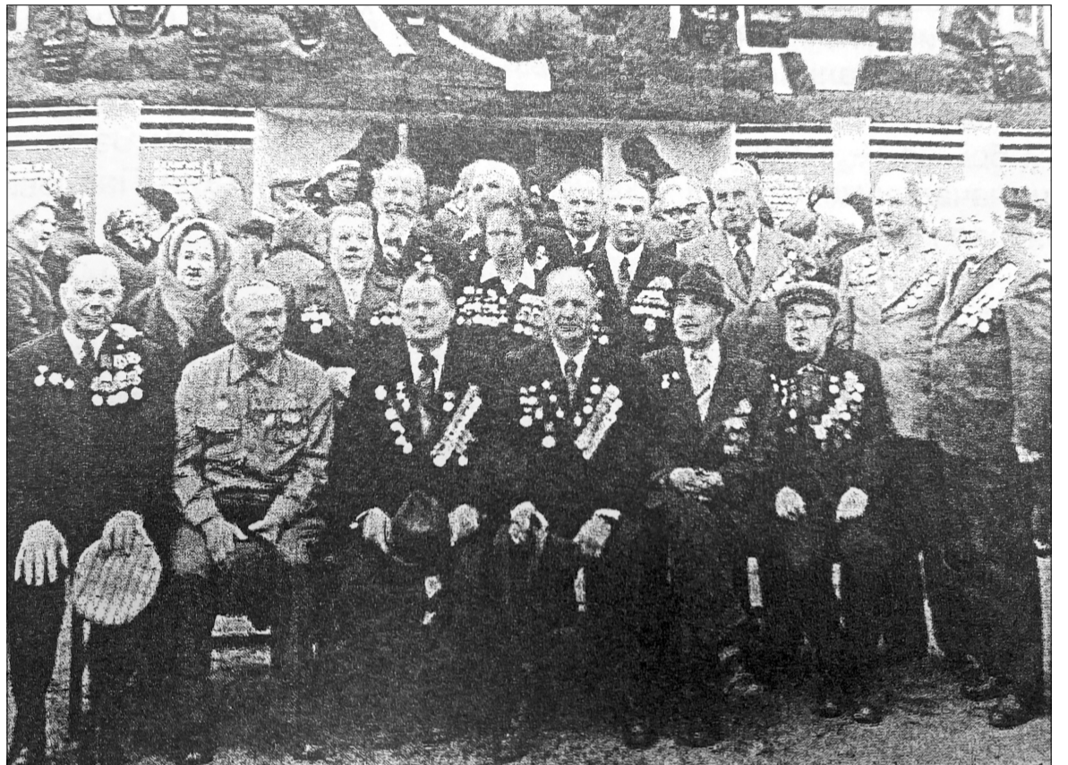
📍 Сталинградцы на встрече с жителями Тёплой Горы 9 мая 1981 г.