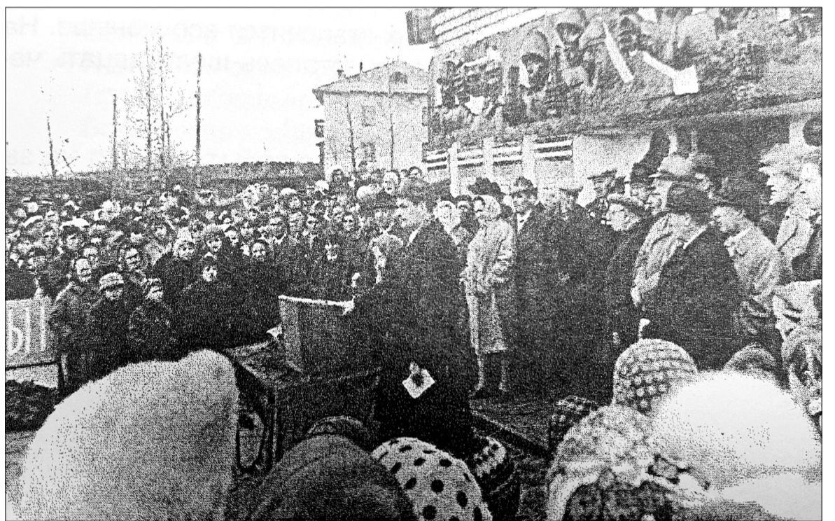
📍 Митинг в Тёплой Горе 9 мая 1981 г.