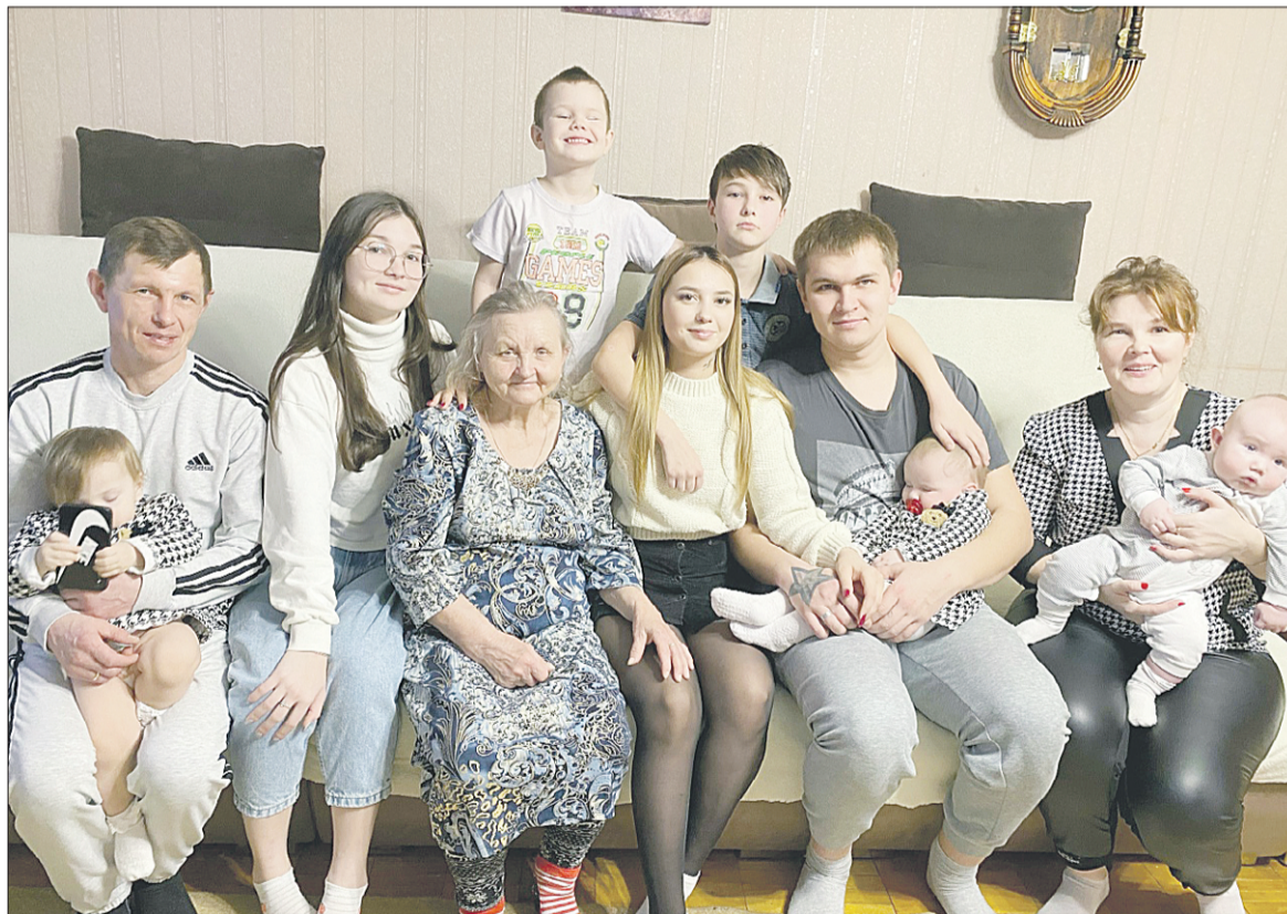
Это лишь треть большой семьи.

— Мы маме этот вопрос постоянно задаём, когда в гости приезжаем, — говорит Ирина. — А ездим к ней часто — каждую неделю кто-нибудь из детей бывает в Суде. Мама всегда отвечает, что никаких проблем с нами никогда не знала. Все послушные были. Если и случалось поругать, то понимали, что за дело. Родители воспитали нас добросердечными. Все мы