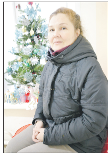
Мама — это судьба.

Есть у Ирины одна потребность — помогать людям. Наверное, это тоже из большой семьи идёт, где все привыкли друг друга поддерживать. Вот и теперь она лет десять волонтерством занимается. Шутит: мол, хобби у неё такое. Сначала в быту кому-то помогала, а теперь и за немощными ухаживает, как сиделка.