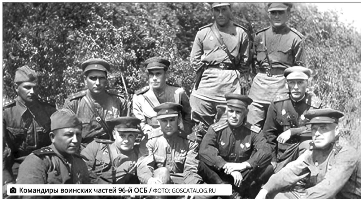
Командиры воинских частей 96-й ОСБ

Следили за сводками Советского информационного бюро. Голос Левитана знали все: и старые, и малые. И, кажется, жизнь замирала во время сообщений. В поселковом Совете и в клубе «Металлург» были вывешены карты с флажками, отмечающими линию фронта.