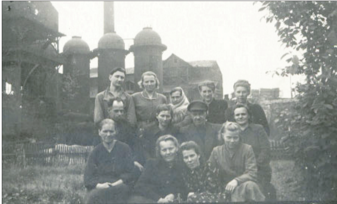
Работники заводской лаборатории, 1942 год.