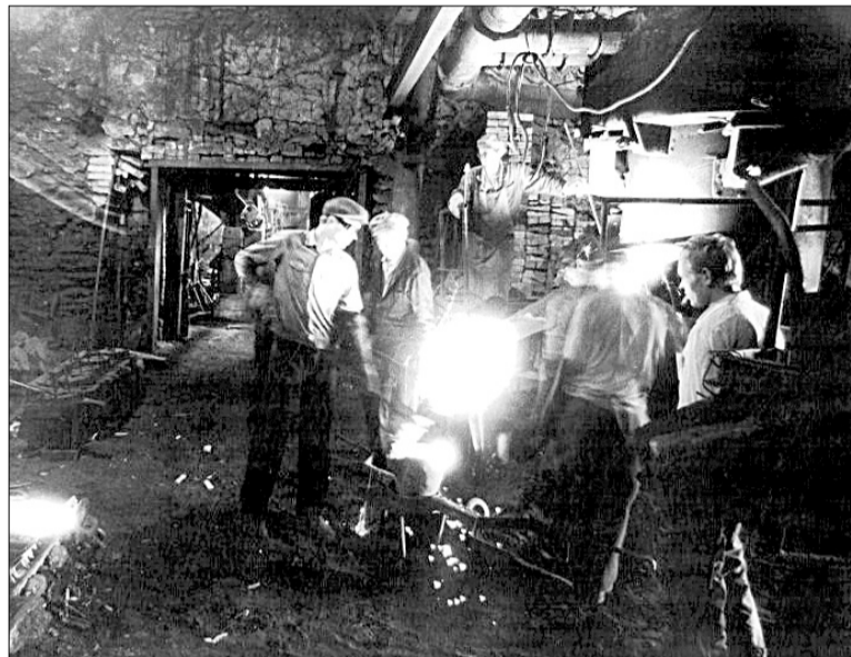
Заливка металла на Бисерском заводе.

Заработная плата была невысокая – 300-400 рублей. Но, несмотря на это и те трудности, с которыми сталкивались заводчане, не было случая, чтобы рабочие отказались от работы. Никто не уходил домой, не выполнив определённой нормы. Отправлялись посылки на фронт: вязаные варежки, носки, тёплые вещи, шили кисеты, набивая их табаком, выращенным на своём огороде. Дети 14-16 лет пришли работать на завод на